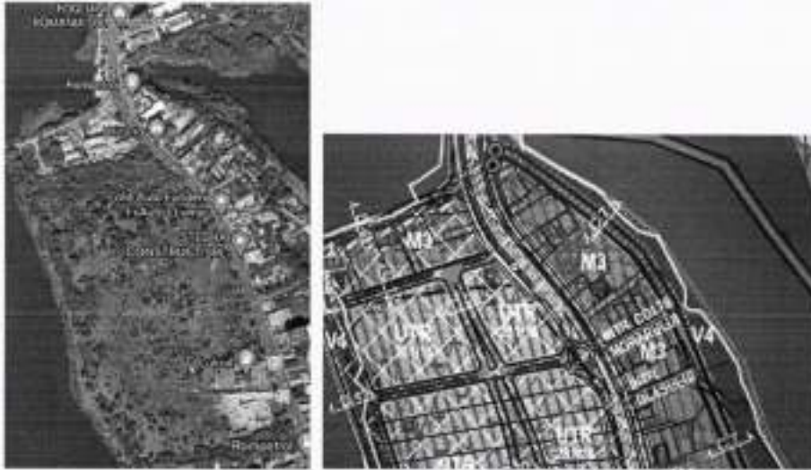
FOTO 3 - Peninsula Fundeni – Pantelimon, fără promenade și spații de recreere, doar cu păstrarea culoarului de vegetație protectivă a malurilor apelor, racordată doar la Șoseaua Fundeni, șosea colmatată de trafic, a cărei lățire prevăzută aparent în PUZ presupune exproprieri masive