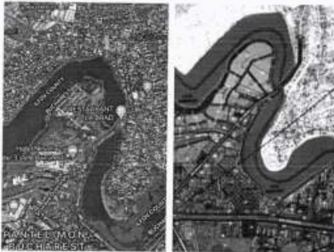
FOTO 2 - Peninsula Dobroiești – Pantelimon, fără promenade și spații de recreere, doar cu păstrarea culoarului de vegetație de protecție a malurilor apelor