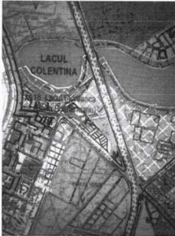
FOTO 9 – Intersecția Barbu Văcărescu cu str. Grigore Țițeica, planșa din avizarea preliminară