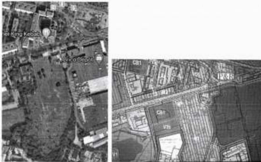
FOTO 5 - Șoseaua Vergului la intersecția cu Sos. Pantelimon. E marcat cu M2 și scuarul verde amenajat din fața blocului din intersecție