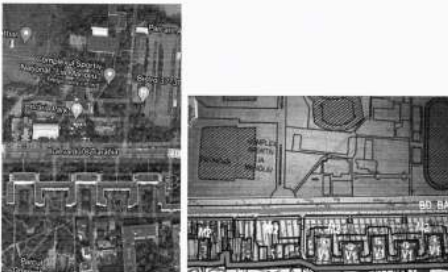
FOTO 6 - Alveolele verzi din fața blocurilor de pe B-dul Basarabia, trecute în M2, deși apar bine evidențiate pe suportul topografic și au suprafețe considerabile