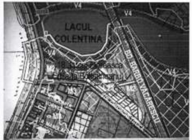
FOTO 10 - Intersecția Barbu Văcărescu cu str. Grigore Țițeica, planșa din etapa de avizare