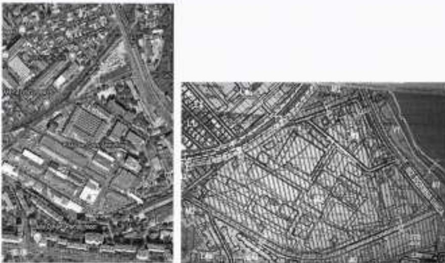
FOTO 4 - Platforma Metaloglobus – racordată în prezent doar la str. Doamna Ghica, în spatele Pieței Delfinului – porțiune colmatată de trafic